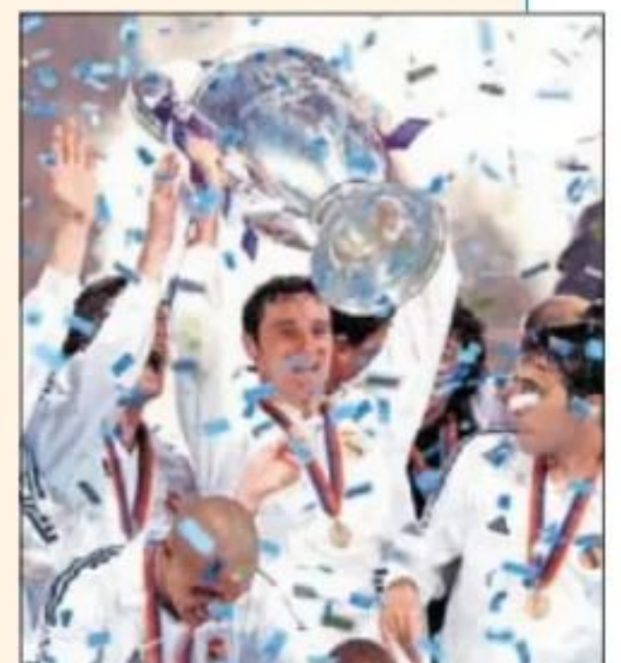
Helguera, con la Champions.