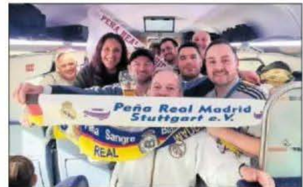
Peña 'Sangre Blanca' de Charleroi. Esta peña belga nos envía esta foto de su viaje a Leipzig. Aquí posan con la peña de Stuttgart.