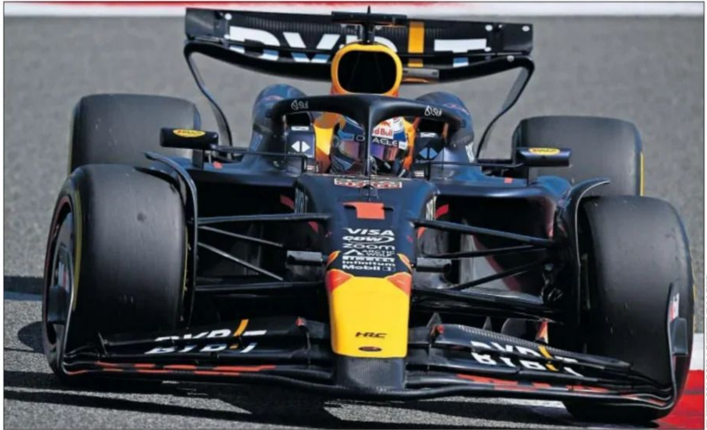
Max Verstappen pilota el Red Bull RB20 durante el primer día de test de pretemporada 2024 en el circuito de Bahrein.