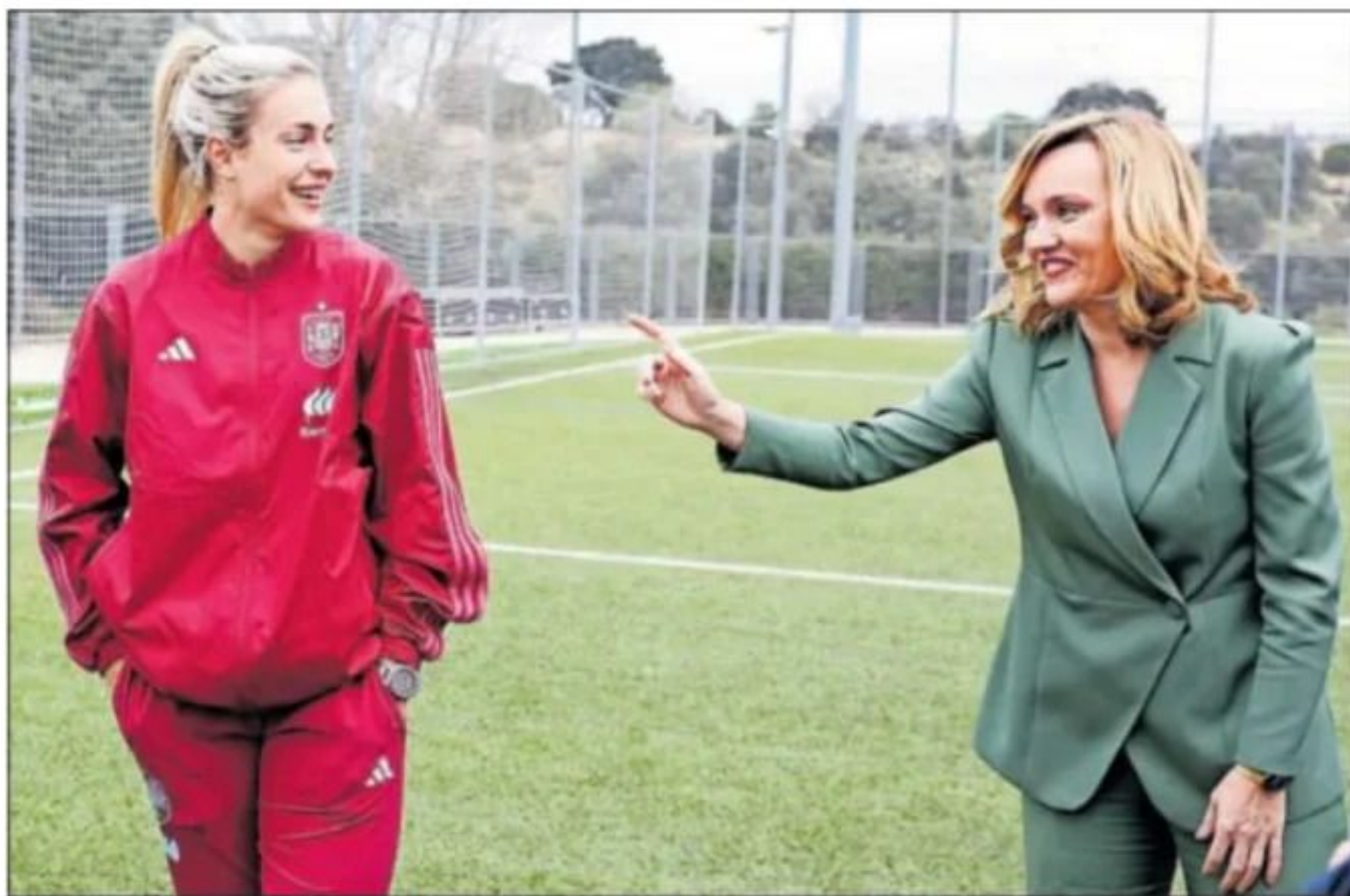
Alexia Putellas, ayer en Las Rozas junto a la ministra de Educación y Deportes, Pilar Alegre.

Entre las convocadas, una Viviane Miedema motivadísima, aunque cauta. La delantera se rompió el cruzado y se perdió el último Mundial, pero ya está a pleno rendimiento: “Después de las vacaciones de invierno jugué mucho. Me siento cada vez mejor, a veces un poco como mi viejo Viv y eso es genial”. La máxima goleadora de todos los tiempos de Países Bajos reconoció: “Vamos a ver día a día cómo me siento, qué puedo hacer. Tenemos que ser inteligentes con lo que estoy haciendo”. Se perfila como titular ante España, aunque no quiere arriesgar porque sabe que su carrera es lo más importante: “No quiero perder años de fútbol, tengo que cuidarme”.