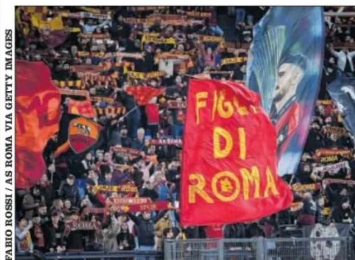
Aficionados de la Roma en el Olímpico.