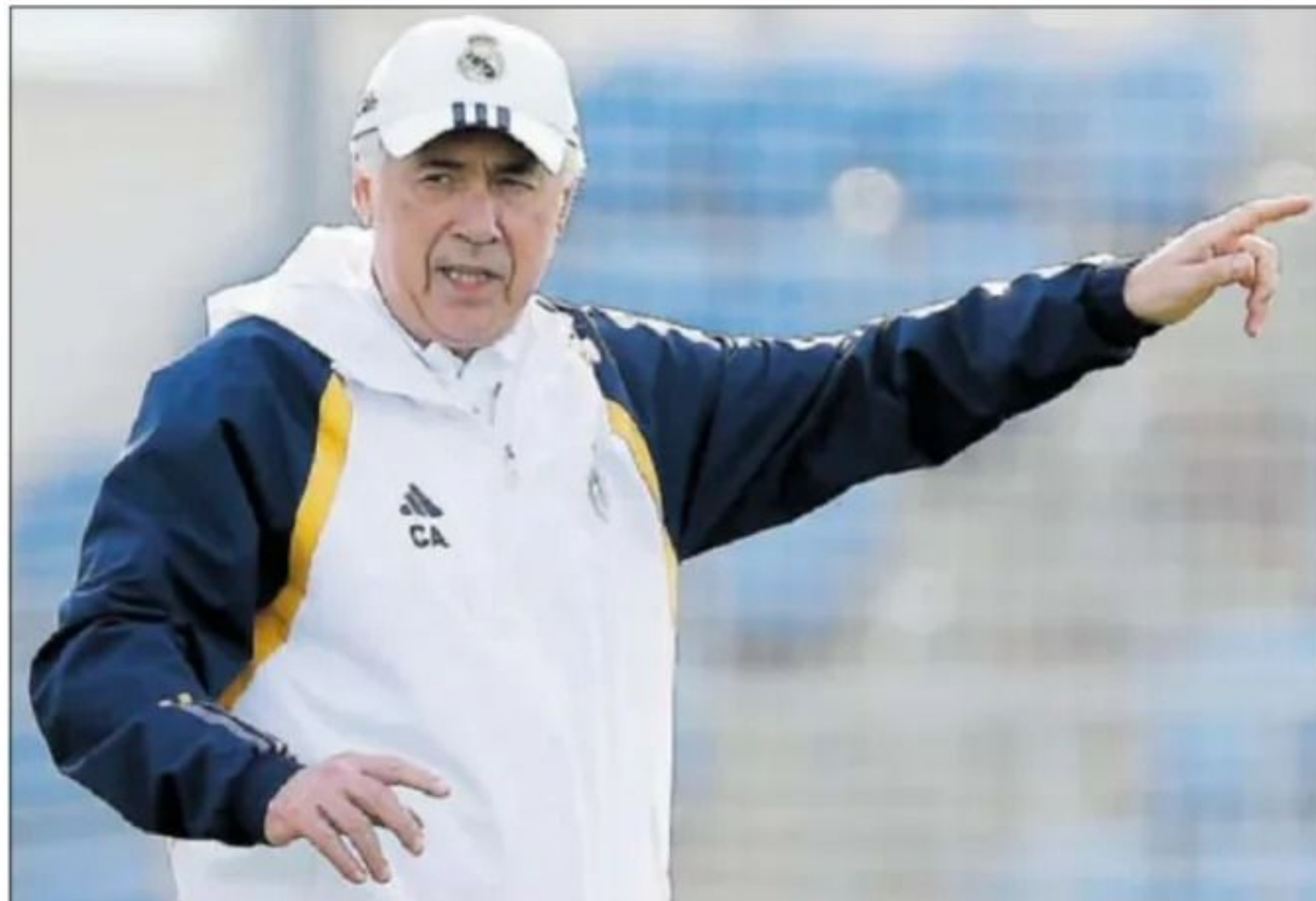
Ancelotti da instrucciones en Valdebebas durante un entrenamiento del equipo blanco.