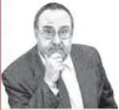
ALFREDO RELANO X@as_relano

Regresar del partido de octavos con un empate no es para quejarse, pero en este caso es una lástima, porque el Barça hizo para merecer más. Sobre todo durante la primera media hora del partido, quizá el tramo de juego más convincente de los de Xavi en toda la temporada. Feroces en la presión, desconcertaron al Nápoles , al que vimos medroso. Y como Gündogan y Lamine estaban muy lúcidos en el área local se sucedían jugadas de peligro. Por momentos pareció que anoche iba a quedar resuelta la eliminatoria, pero el gol no llegó en esa larga fase de juego espléndido. A la media hora la marea del Barça cedió y el Nápoles alcanzó el descanso sin daño.*