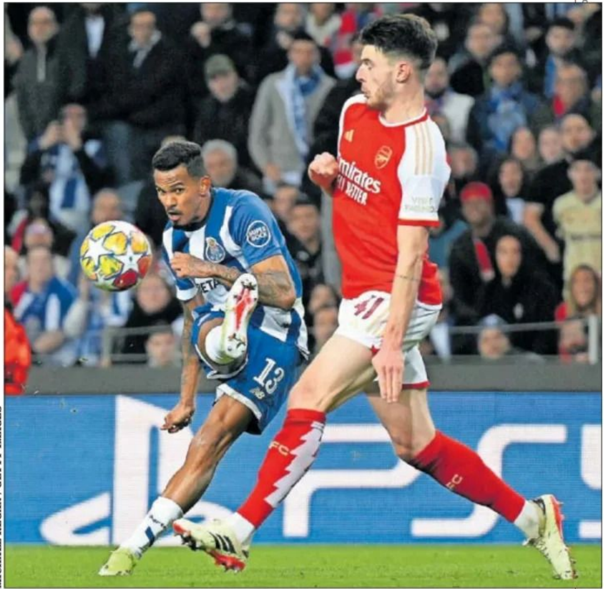
Galeno, en el momento en el que chutó a puerta para hacer el gol del Oporto.

D ijo el arquero portista Costa en la previa del partido que si realmente los gunners eran favoritos, "tendrán que demostrarlo". Y no le faltó razón. Después de siete temporadas sin hacer acto de presencia en octavos, el Arsenal de Arteta pecó de novato en su visita a Do Dragão y la ida entre dragões y gunners se resolvió con victoria local (1-0). El conjunto londinense, que venía de marcar 21 goles en sus últimos cinco encuentros de Premier, fue incapaz siquiera de tirar a portería en Oporto, y lo pagó caro. El siempre competitivo Oporto de Conceição, con más posesión y experiencia durante las últimas temporadas en Europa, vio recompensada su actuación con un golazo de Galeno en la última jugada del partido, que heló la sangre de Arteta y sus pupilos. El incombustible Pepe, que se convirtió en el jugador de más edad en participar en los octavos de la Champions (40 años), lideró a la zaga local para secar por completo a Saka y compañía. Aunque todavía restan 90 minutos en el Emirates, el Oporto baja al Arsenal de las nubes.