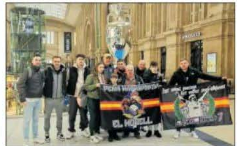
Peña de El Morell (Tarragona). Esta viajera peña catalana se desplazó a Leipzig en buen número para animar a su Real Madrid.