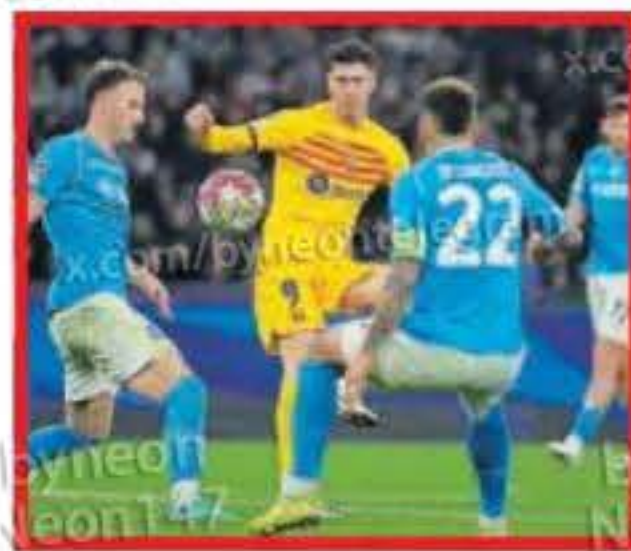
Lewandowski, ante Di Lorenzo.

Regresar del partido de octavos con un empate no es para quejarse, pero en este caso es una lástima, porque el Barça hizo para merecer más. Sobre todo durante la primera media hora del partido, quizá el tramo de juego más convincente de los de Xavi en toda la temporada. Feroces en la presión, desconcertaron al Nápoles , al que vimos medroso. Y como Gündogan y Lamine estaban muy lúcidos en el área local se sucedían jugadas de peligro. Por momentos pareció que anoche iba a quedar resuelta la eliminatoria, pero el gol no llegó en esa larga fase de juego espléndido. A la media hora la marea del Barça cedió y el Nápoles alcanzó el descanso sin daño.*