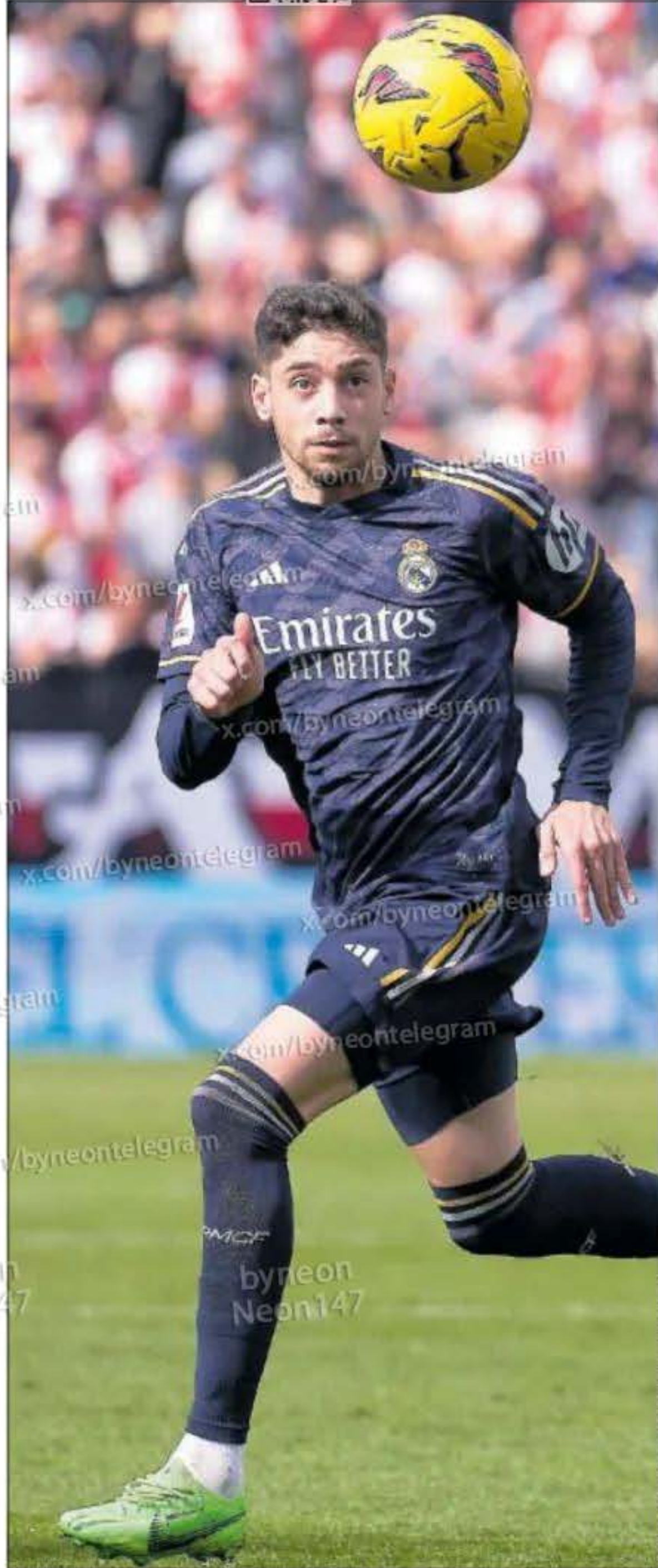
Valverde fija su mirada en el balón durante el partido contra el Rayo.

rompeliñas con conducciones. Dicho y hecho; 9,1 progresiones con balón por partido, líder entre los mediocampistas en LaLiga, frente a las 4,1 de la temporada pasada. Y está firmando su mejor curso como arquitecto: promedia 59,9 pases con éxito por 90 minutos y 36,5 en campo contrario, superando su techo en ambos campos con holgura y sólo pierde 5,8 balones, por los 7,7 de las dos campañas previas. Una mayor participación en el juego y riesgo en la conducción no se ha traducido en una merma en la precisión y el control, al contrario. Sigue buscando portería con asiduidad (1,7 tiros por cada 90', apenas 0,2 menos que la campaña pasada), aunque la efectividad sí que se ha resentido. No preocupa a Ancelotti, pues las tareas de este nuevo Valverde son otras. "Es indispensable", sintetiza el de Reggiolo. Sin medias tintas. Valverde, en todas sus versiones, y diez más.