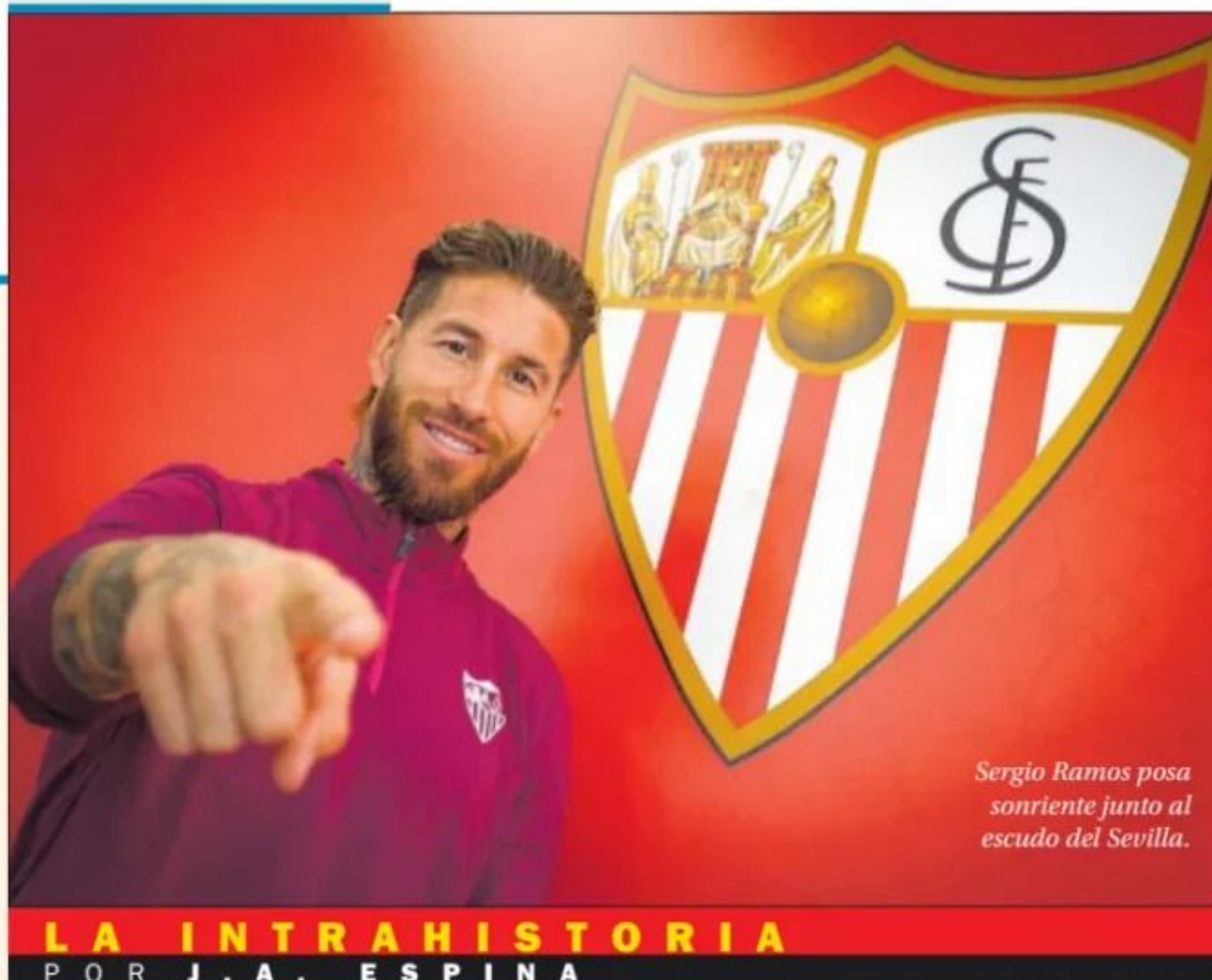
Sergio Ramos posa sonriente junto al escudo del Sevilla.

en el mercado invernal han dejado al camero como segundo mandamás de la plantilla nervionense. Pero de facto, Sergio ya se ha convertido en el gran líder del vestuario, el hombre