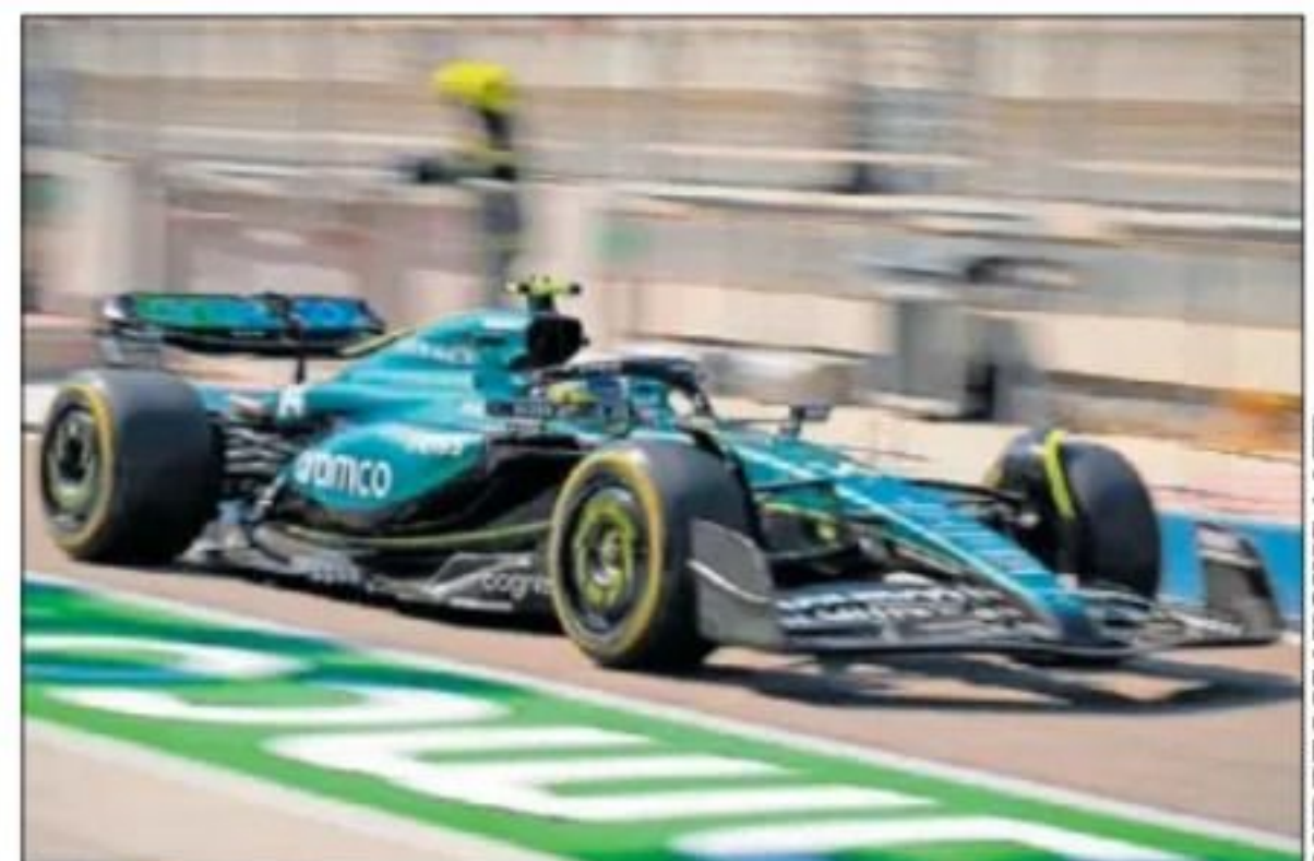
Fernando Alonso sale del garaje con el AMR24 en Bahrein.

Sobre la aportación del español: “Fernando ha hecho un gran trabajo, terminó antes de lo esperado. La mañana fue bien, un buen comienzo. El programa era extenso pero todo fue como un reloj, de hecho estábamos fuera en cuanto el semáforo se puso verde”. En este segundo día de test Alonso vuelve a pilotar en el turno matinal y mañana, dispondrá de la última tarde. —J. B.