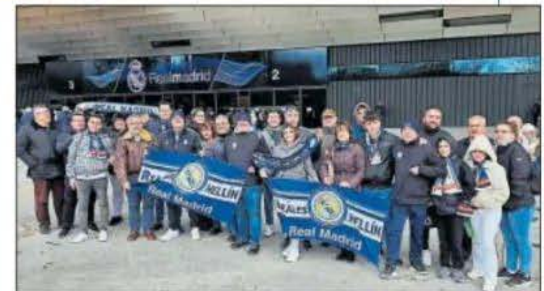
Peña Reales de Hellín. Esta feliz y activa peña de esta localidad albaceteña llenó un autobús para ver el 4-0 del Real Madrid al Girona.