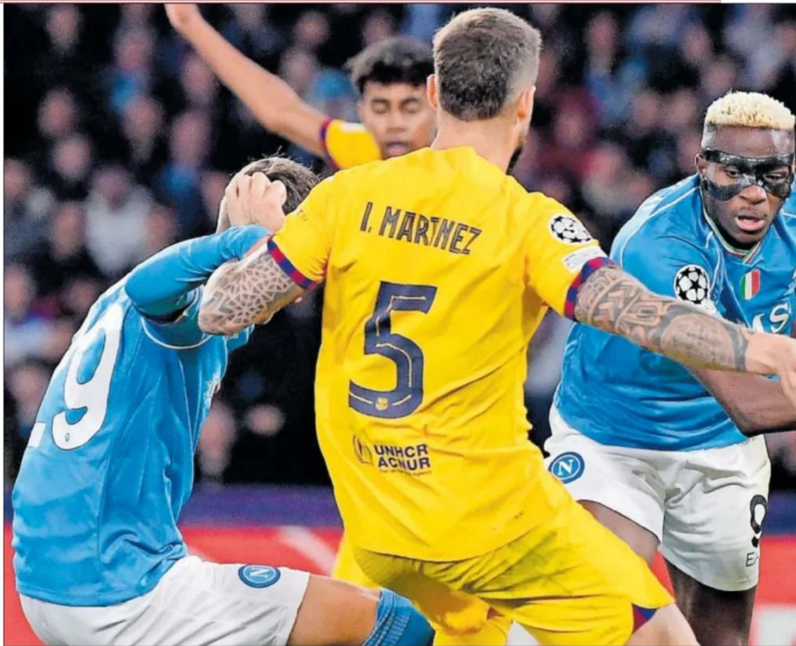
Osimhen, que finalmente marcó el gol del empate, intenta escaparse de tres defensas del Barcelona, Iñigo Martínez, Koundé y Araújo.

El Barça añadió un apercibido más para el partido de vuelta de octavos de final de Champions. En caso de que los de Xavi pasen a cuartos de final, De Jong no jugará si ve otra tarjeta amarilla. Araújo y João Félix, los otros dos apercibidos, no vieron cartulina y podrán estar en el Lluís Companys el próximo 12 de marzo. Iñigo y Christensen, que vieron amarilla, suman la primera en la competición.