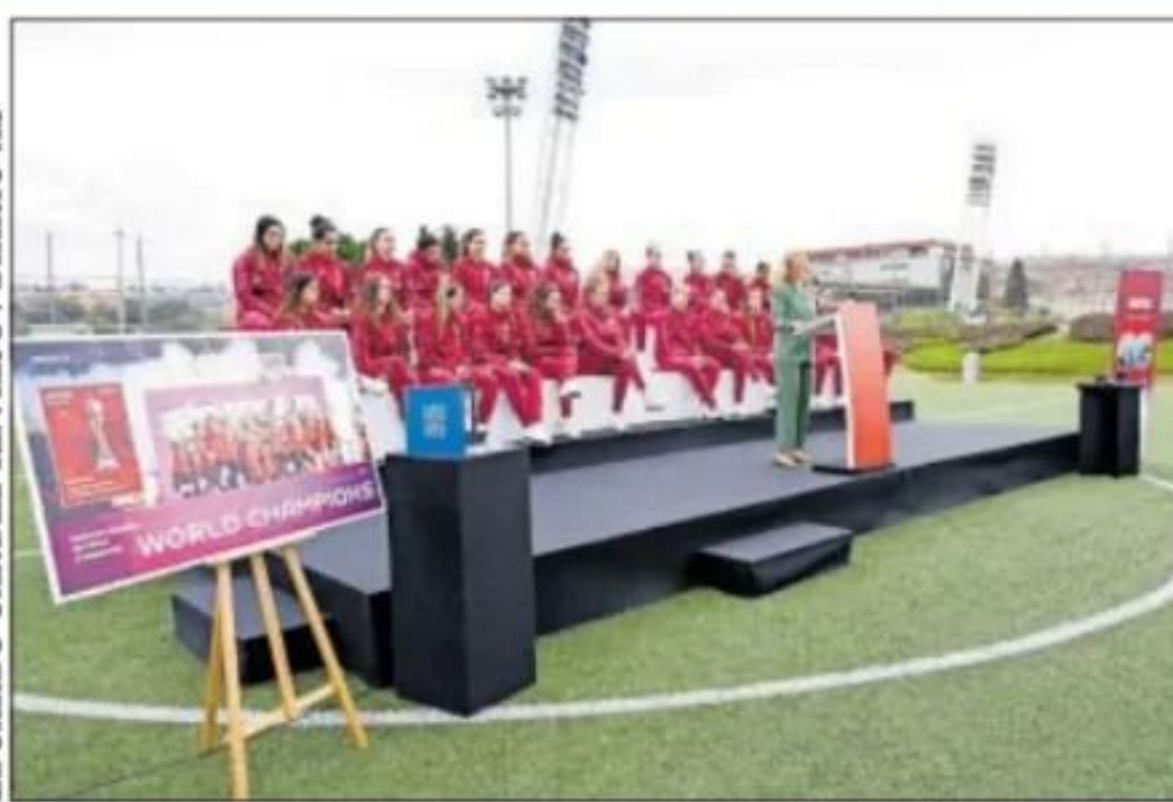
La Selección, con el sello conmemorativo del Mundial.