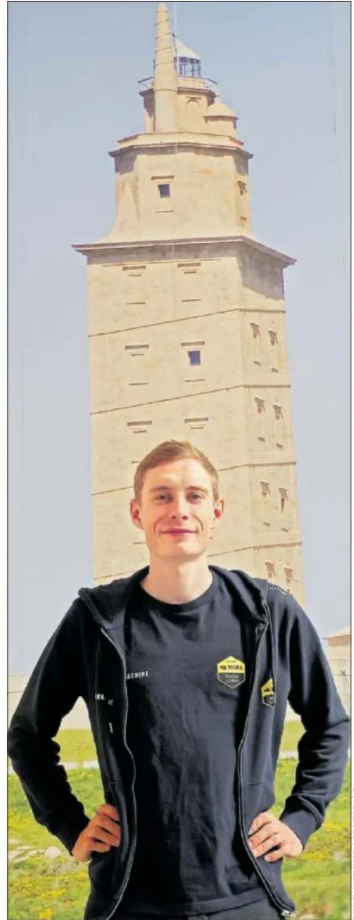
Vingegaard posa para AS con una imagen de la Torre de Hércules.