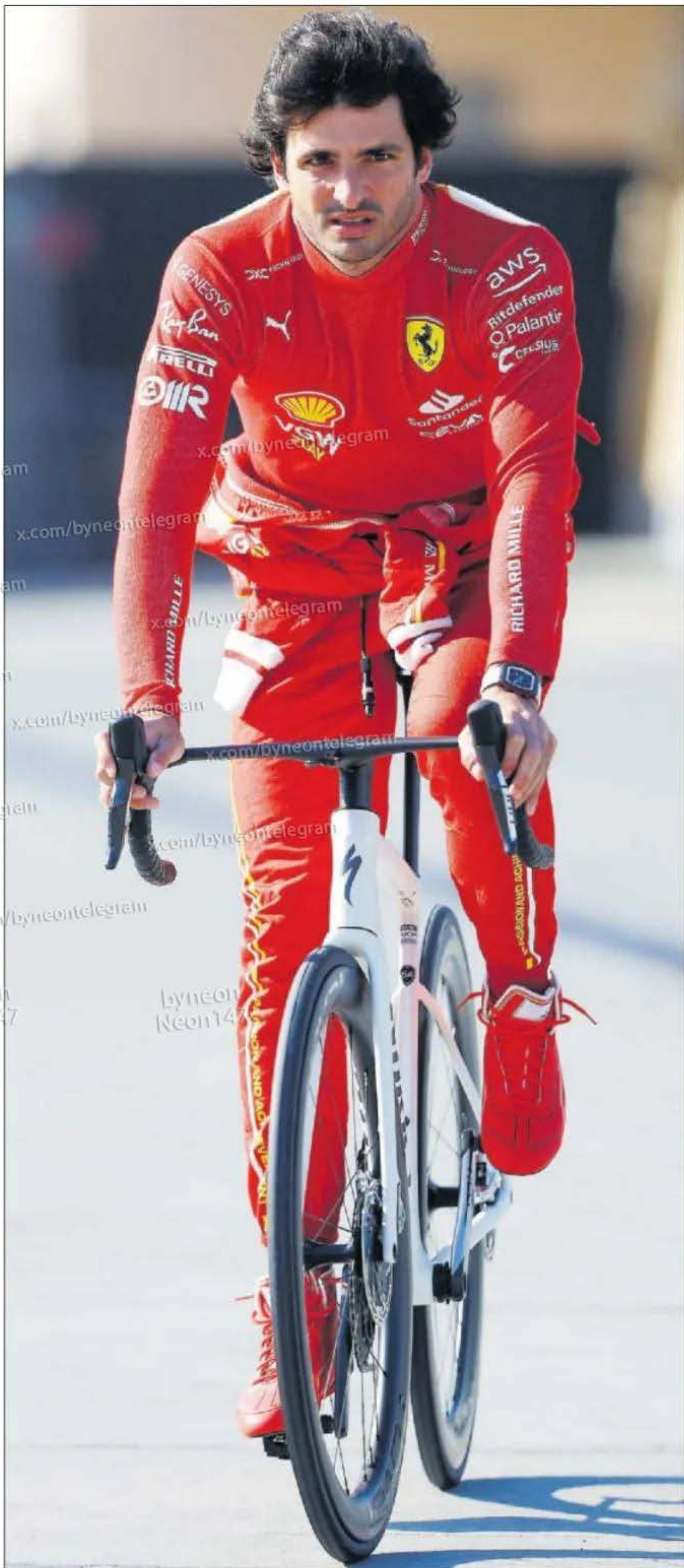
Carlos Sainz pedalea por el paddock del circuito de Sakhir, en Bahrein, antes del primer día de test.

en la Fórmula 2, es el júnior de la firma alemana con mayor proyección. Pero eso no quiere decir que el año que viene pueda subirse al asiento que ocupaba Lewis Hamilton. Toto Wolff tiene pilotos en cartera, como Esteban Ocon, y podría ofrecer un contrato corto para hacer tiempo hasta la llegada del talento italiano. Aunque si completa un inicio de año firme en la F2, puede que se aceleren algunos procesos. "Lleva con nosotros desde que tenía 11 años. Acaba de cumplir 17, llegará a la F1 y lo hará bien... pero todavía no ha empezado en la F2. Hay pilotos excelentes en la parrilla y no lo decidiremos pronto", argumenta Wolff.