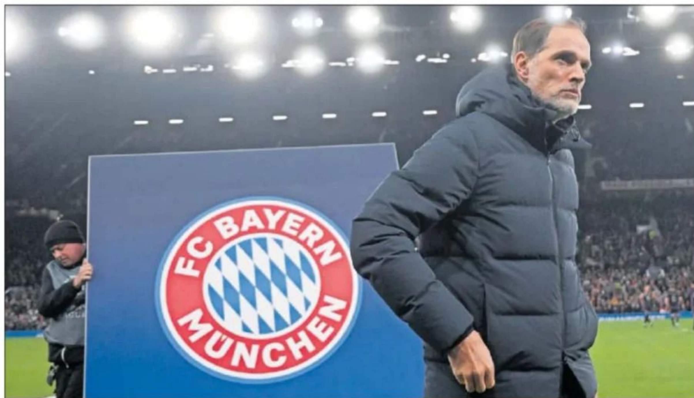
Thomas Tuchel, antes de un partido del Bayern de esta temporada.